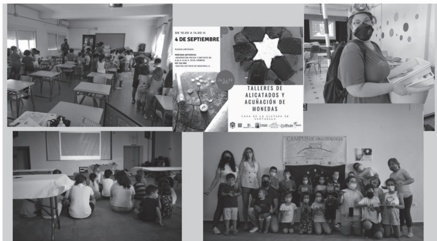
Fig. 5. Talleres educativos