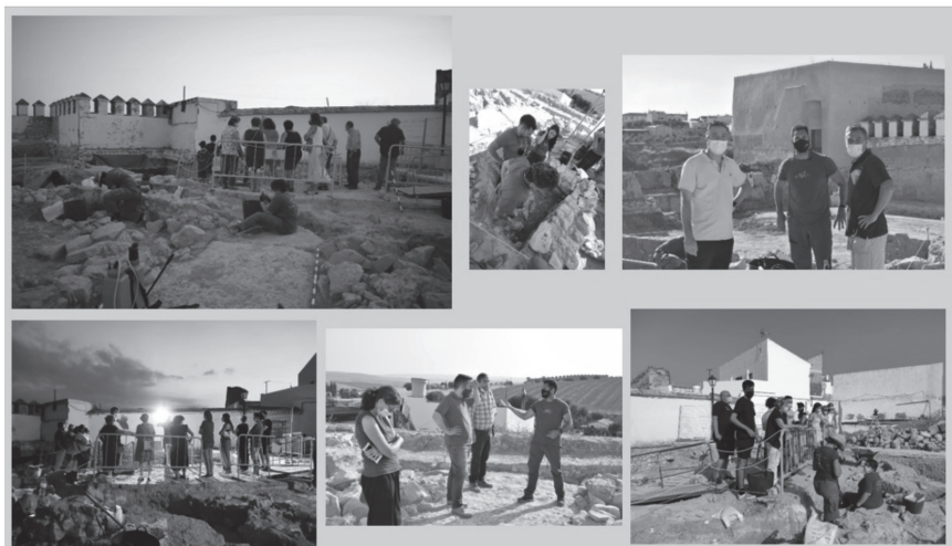
Fig. 4. Actividad “Abierto por Obras” y visitas institucionales al yacimiento

Infantil y Primaria “Urbano Palma” de Santaella, en la que tuvimos la oportunidad de acercar la arqueología a los más pequeños, mostrando de forma lúdica la realidad esta profesión científica y desmintiendo alguno de sus grandes mitos.