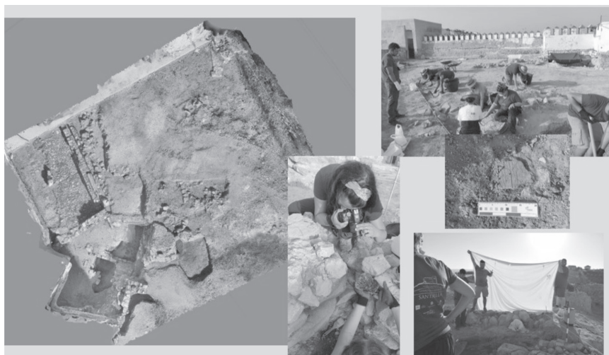
Fig. 2. Yacimiento arqueológico Cerro del Castillo de Santaella. Proceso de excavación

gico, ha hecho posible que distintos alumnos universitarios pudieran realizar prácticas curriculares en arqueología de campo y laboratorio, becados con alojamiento y manutención gracias al citado convenio y de manera totalmente gratuita.