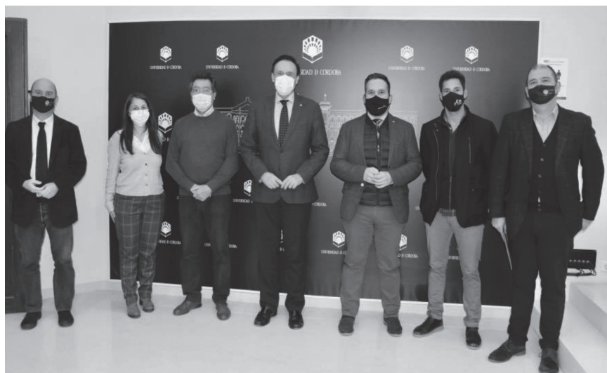
Fig. 1. Representantes institucionales de la Universidad de Córdoba y del Ayuntamiento de Santaella (Córdoba), junto a miembros del Grupo de Investigación Hum-262. Investigación en Recursos Patrimoniales (INREPA)

En el citado Convenio Específico de Colaboración firmado entre el Ayuntamiento de Santaella y la Universidad de Córdoba (Grupo PaiHum-262) se establecen las bases y objetivos a seguir por la institución académica para la Investigación, gestión y puesta en valor del patrimonio cultural y natural del Cerro del Castillo de Santaella (Córdoba) .